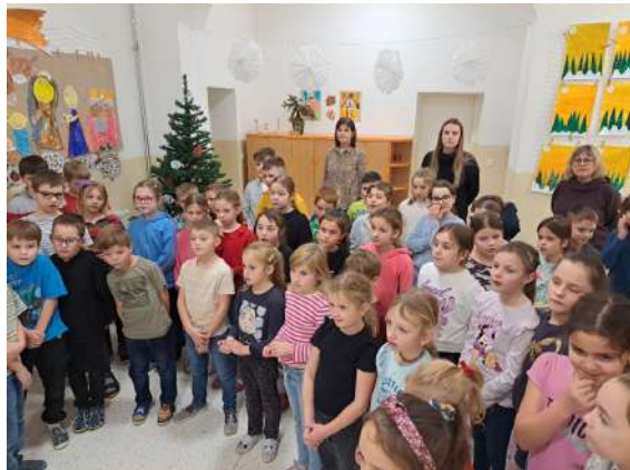
foto ze společného předvánočního koledování nám poslali třetíáci a prvňáci z Přední budovy.